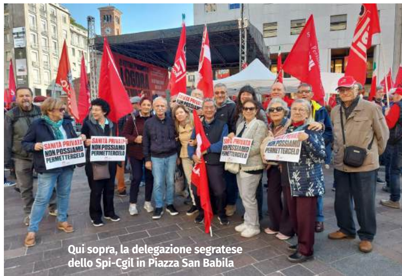
Qui sopra, la delegazione segratese dello Spi-Cgil in Piazza San Babila

LA MANIFESTAZIONE RITORNA AL PARCO ESPOSIZIONI IL 16-17 NOVEMBRE