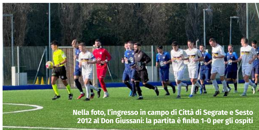
Nella foto, l'ingresso in campo di Città di Segrate e Sesto 2012 al Don Giussani: la partita è finita 1-0 per gli ospiti