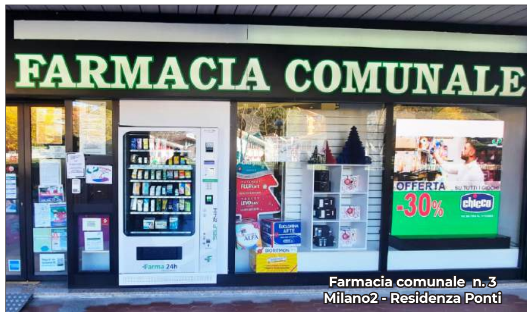
Farmacia comunale n. 3 Milano2 - Residenza Ponti