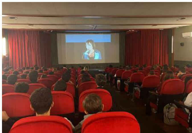
Nella foto, gli studenti del liceo durante la proiezione

Il film, poi le parole della mamma del 15enne che si tolse la vita a causa del bullismo. In 250 in sala a Segrate per l'iniziativa