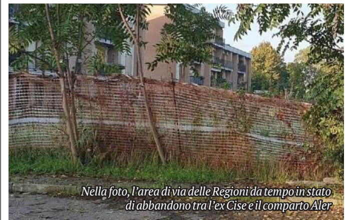
Nella foto, l'area di via delle Regioni da tempo in stato di abbandono tra l'ex Cise e il comparto Aler