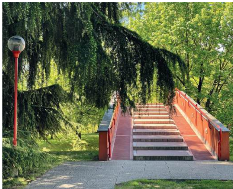
Nella foto sopra, uno dei ponti che collegano le residenze a tutti i servizi del quartiere senza dover mai "incontrare" il traffico automobilistico

ragazzi, possiede il pregio di essere stata concepita controcorrente per gli standard dell'epoca che prevedevano la massima cemen-