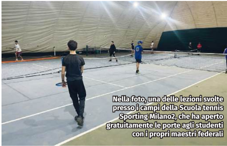
Nella foto, una delle lezioni svolte presso i campi della Scuola tennis Sporting Milano2, che ha aperto gratuitamente le porte agli studenti con i propri maestri federali

Il tennis a scuola. Succede all'Istituto Sabin di Milano2 e Redecesio che quest'anno ha aderito al progetto "Racchette in classe" promosso dalla Federazione Italiana Tennis. L'iniziativa, attiva su scala nazionale da 12 anni, mira ad avvicinare al mondo della racchetta gli studenti, dall'infanzia alle scuole superiori. A Segrate il progetto ha coinvolto ragazze e ragazzi delle medie dei due plessi e ha coinvolto gli istruttori della Scuola Tennis Sporting Club Milano2. A Redecesio, durante il mese di dicembre, i maestri federali hanno tenuto lezioni nella palestra scolastica, mentre a Milano2 gli studenti si sono messi alla prova sui campi dello Sporting Club Milano2, che ha messo a disposizio-