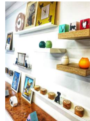
Sopra, le urne personalizzabili per la conservazione delle ceneri: l'agenzia si occupa anche del recupero della salma degli animali e della cremazione

la possibilità di un momento di commiato. «Chi lo desidera può organizzare un rito di saluto qui in sede», aggiunge Viviana. E i costi? Facendo un rapido preventivo online, si va dai 90 euro per la cremazione collettiva di un cane di piccola taglia, senza urna ma con uno scrigno contenente un ciuffo