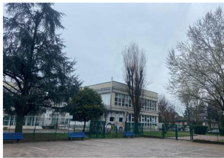
Sopra, la storica scuola elementare De Amicis con il suo grande cortile

del plesso (e quindi infiltrazioni) per la caduta di foglie sul tetto. Ma le cose stanno davvero così? Per fare chiarezza bisogna fare un passo indietro all'indagine iniziata nell'autunno 2023 che ha interessato tutti gli alberi dei giardini scolastici di Segrate: una popolazione di quasi 700 esemplari, esaminati per un check-up capillare voluto dall'assessore all'Ambiente Alessandro Pignataro in seguito agli eventi meteorologici estremi che causarono il crollo di decine di alberi in tutta la città, per scongiurare possibili situazioni di pericolo. «L'obiettivo primario è la sicurezza, in particolare in un contesto sensibile come quello scolastico - ha spiegato l'assessore, che di professione è agronomo e quindi esperto in materia - questa indagine ci ha consentito di fotografare in modo puntuale lo stato di salute