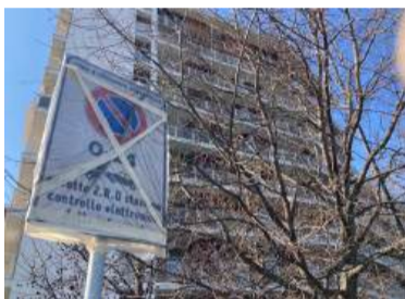
Sopra, la segnaletica per la nuova ZRU lungo tutta la via Caravaggio

sosta, che registra flussi particolarmente intensi per la presenza del passante ferroviario e quindi meta di pendolari segratesi e più in generale dell'est milanese. Il