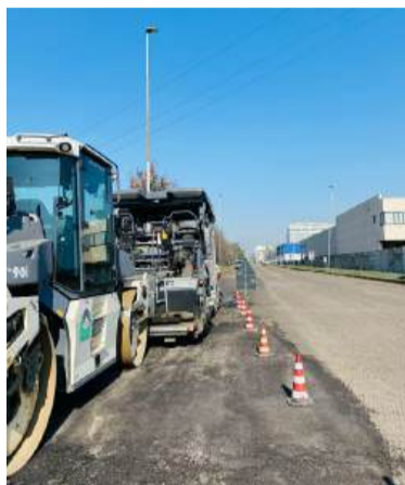
I lavori in corso per la riasfaltatura della strada, a Milano Oltre