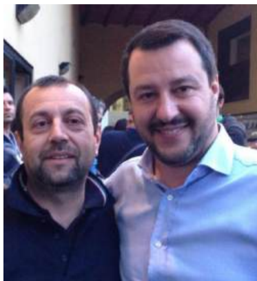
Andrea Donati con Matteo Salvini

«Ciascun partito porterà al tavolo un paio di nomi, magari sia di estrazione politica che individuati nella società civile o nell'imprenditoria segratese. Da lì inizieremo a discutere per scegliere quello con più chances di vittoria. Ma le prossime riunioni saranno dedicate alla stesura di un programma unitario, che