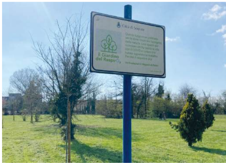
Sopra, il cartello che identifica lo spazio dedicato alle vittime del Covid