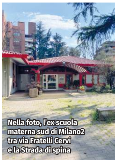
Nella foto, l'ex scuola materna sud di Milano2 tra via Fratelli Cervi e la Strada di spina

L'ex scuola materna sud di Milano2 resta senza inquilini. Anche l'ultimo bando, scaduto il 28 febbraio, è andato deserto: nessuno ha manifestato interesse per affittare l'ampio e prestigioso stabile, occupato fino all'anno scorso da una scuola inglese. La base d'asta era di 85mila euro e la gara era aperta a realtà del settore scolastico o culturale, ma nessuno ha presentato offerte. Resta dunque inutilizzato l'edificio, ristrutturato di recente, all'ingresso di Milano2, che l'amministrazione comunale aveva già tentato di affittare insieme ai locali al primo piano di Cascina Ovi, senza successo. Per entrambi si cercava un inquilino in grado di offrire servizi formativi o educativi, ma l'assenza di interesse suggerisce un cambio di strategia. «Dobbiamo prenderne atto e ampliare la platea dei possibili interessati - conferma il sindaco Paolo Micheli - non apriremo per ora a uffici o ristorazione, ma nel prossimo bando includeremo altri tipi di servizi, come quelli sanitari o paraospedalieri». L'idea del sindaco era trasformare Segrate, e