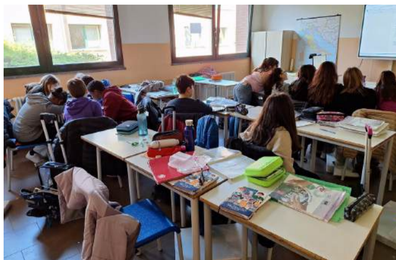
Nella foto, la classe 1F della scuola segratese, durante l'evento del Politecnico

I ragazzi si sono messi alla prova con "enigmi" matematici e la classe 1F si è classificata al primo posto del proprio ordine di scuola