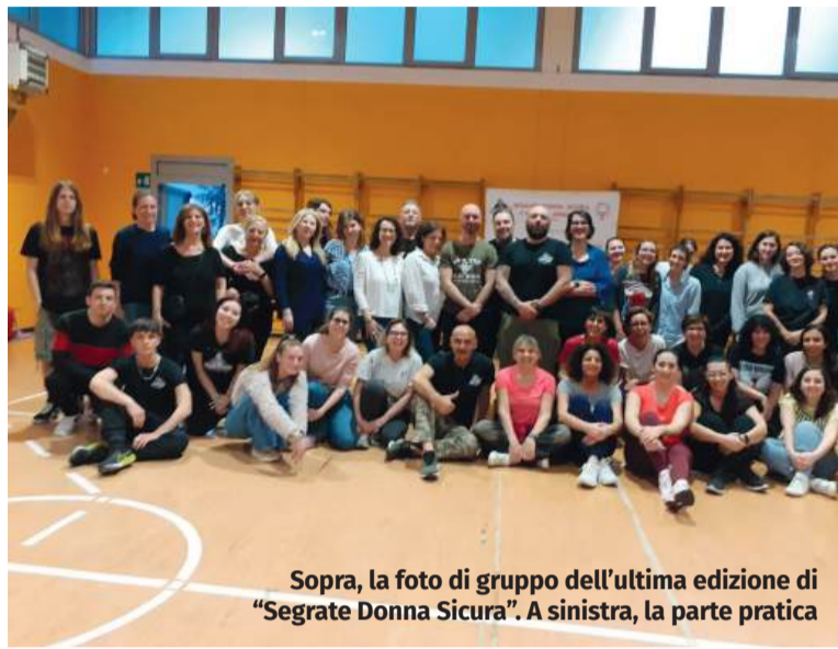
Sopra, la foto di gruppo dell'ultima edizione di "Segrate Donna Sicura". A sinistra, la parte pratica

sce positivamente è che c'è lo stesso interesse del primo anno, anzi stiamo aprendo collaborazioni con altre realtà cittadine, come l'Associazione Gaetano Chindemi con la quale abbiamo organizzato un incontro al centro civico di via Verdi. E il fatto che Redecesio sia diventata la "capitale" segratese del con-