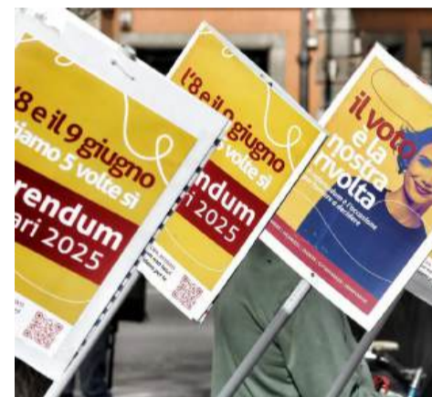
Qui sopra, le immagini della campagna per il referendum dell'8 e 9 giugno sui temi del lavoro e della cittadinanza

legati al lavoro, su licenziamenti, durata dei contratti e sicurezza nei cantieri e non solo. Il quinto prevede invece il dimezzamento dei tempi di residenza legale nel nostro Paese per ottenere la cittadinanza italiana, da 10 anni a 5. Le iniziative per promuovere le ragioni del “Sì” saranno di vario genere e respiro, con il tradizionale banchetto che la farà comunque da padrone anche qui a Segrate. Dal 29 aprile se ne saprà di più, questo è certo.