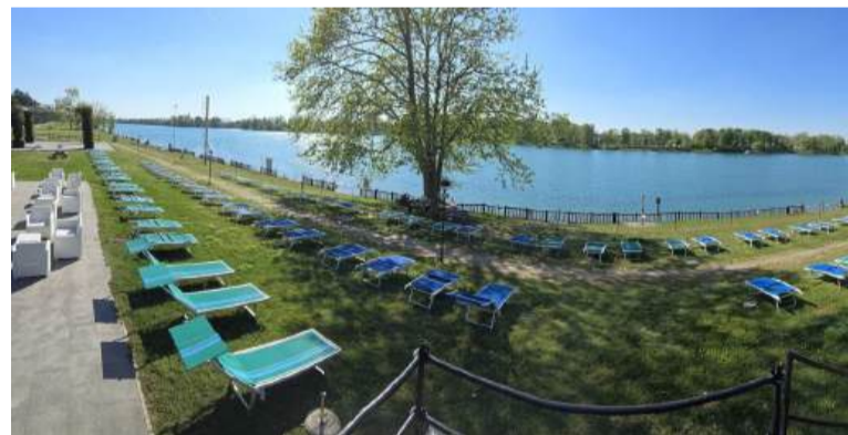
Nella foto sopra, la spiaggia del club "Papaya" situata sulla riva est

Al via l'alta stagione del Parco Idroscalo, con molte novità. Sono state assegnate, attraverso bandi pubblici, diversi spazi che hanno portato all'apertura di nuove attività e servizi. Una delle più interessanti, almeno sulla carta, è Kora , spazio polifunzionale che aprirà a fine maggio sulla spiaggia est. Si articolerà in quattro aree: spazio ristoro, wellness area attrezzata e zone dedicate allo yoga; area relax con spazi per il coworking e infine beach party dal giovedì alla domenica dal pranzo al tramonto con musica. Altra novità è Idrobeach : il nuovo punto ristoro sulla riva est. Dal primo giugno aprirà anche la zona piscina con uno spazio completamente rinnovato dedicato a tuffi, nuoto e tintarella. Per l'estate si organizzeranno anche dj set con aperitivo e ballo serale. Sempre dal primo giugno riapre anche l'altra piscina del Parco: Villettabeach , in zona ovest, con due vasche, di cui una dedicata ai più piccoli. Anche qui è presente un punto ristoro. Da sottolineare anche l'arrivo di Alcatraz, storica discoteca milanese, sulle rive del lago. Da quest'anno il locale ha