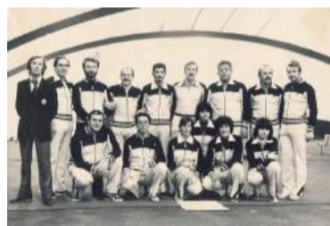
In alto, il campo di tiro in via Pio La Torre, sopra la vasca volano del Gruppo CAP. Sopra, in fondatori della Compagnia Arcieri Novogro

Non è il primo trasloco, per gli Arcieri che dopo essere nati a Nove-