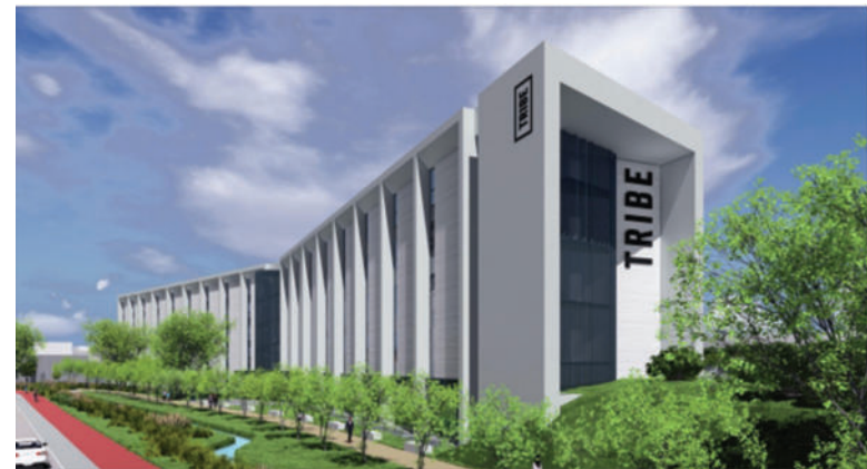
Sopra, il render del grande albergo che sorgerà a Novegro, sotto quello previsto nella zona industriale Marconi in via Galvani

minazione pubblica nel tratto tra via Schering e via Pacinotti, la riorganizzazione delle aiuole verdi per migliorare l'accesso alle attività produttive, oltre a nuova segnaletica e nuovi parcheggi. Prevista anche la riqualificazione del parcheggio a servizio del centro sociale Baraonda, con aree verdi attrezzate e nuovo arredo urbano. «Si tratta di un intervento di rigenerazione urbana – spiega l'assessore al Terri-