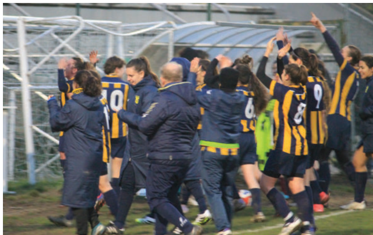
L'esultanza del Città di Segrate dopo la vittoria con sei reti a zero

Le due squadre femminili di Segrate saldamente in cima alla classifica con vittorie schiacciati. Super goleada