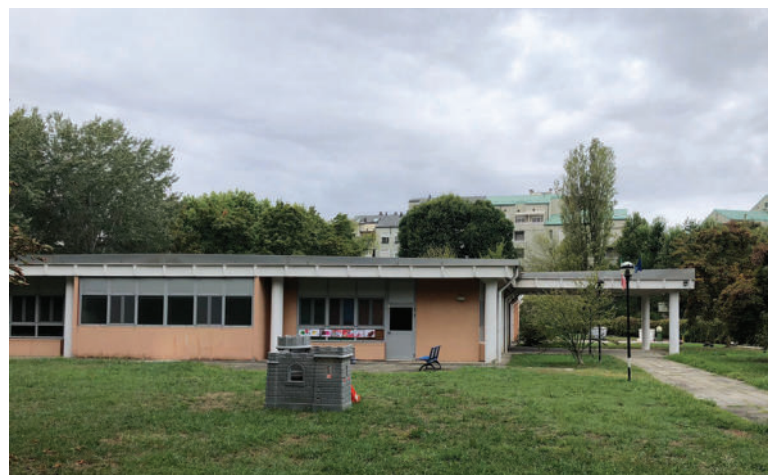
Uno dei plessi dell'Infanzia dell'Istituto Galbusera di San Felice