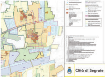
Una delle tavole presenti all'interno del corposo Piano

Il Consiglio Comunale di Segrate ha avviato ufficialmente l'iter per il nuovo Piano di Governo del Territorio (PGT), lo strumento urbanistico che disegnerà il volto della città del futuro. Dopo l'adozione in aula e la deposizione degli atti si apre ora la fase cruciale per i cittadini: quella partecipativa delle osservazioni.