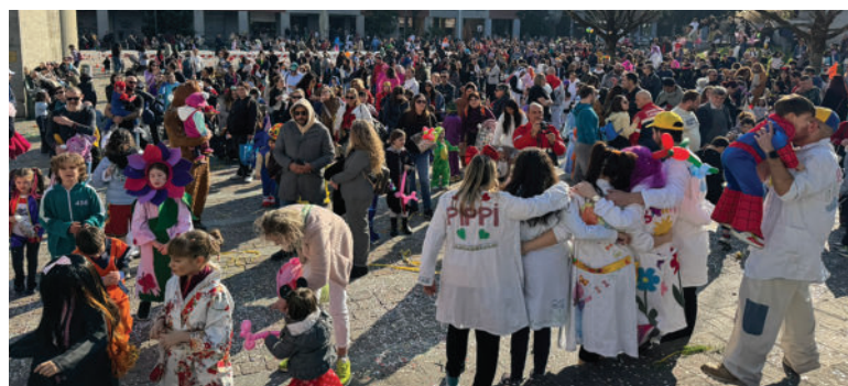
Qui sopra, folla in centro durante una passata edizione. A sinistra un divertente clown. I travestimenti più belli saranno premiati

Il divertimento raddoppia con la tradizionale festa organizzata da Pro Loco in collaborazione con CPS, Associazione Culturale Il quartiere e SorridiMi per sabato 21 febbraio. Ritrovo nel parcheggio di Cascina Commenda alle 14, per partire con una sfilata lungo le vie Commenda, Begonia, Papa Giovanni XXIII, Gramsci, Roma, XXV Aprile. Niente carri, come