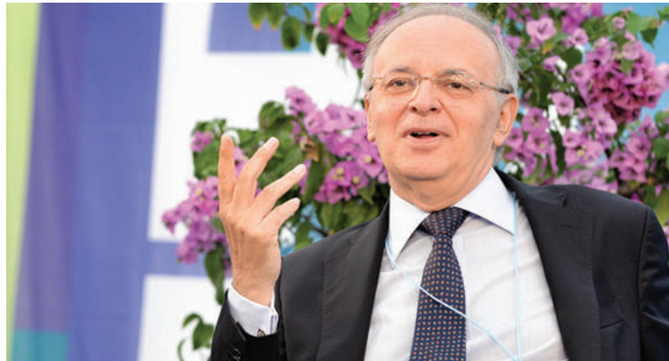
Piercamillo Davigo, magistrato di Mani Pulite, durante un dibattito

Il sistema progettato dall'esecutivo, secondo Davigo, porta verso un «sorteggio truccato», che favorisce in modo evidente l'influenza politica. A questi elementi, secondo il comitato, ci sarebbe da aggiungere