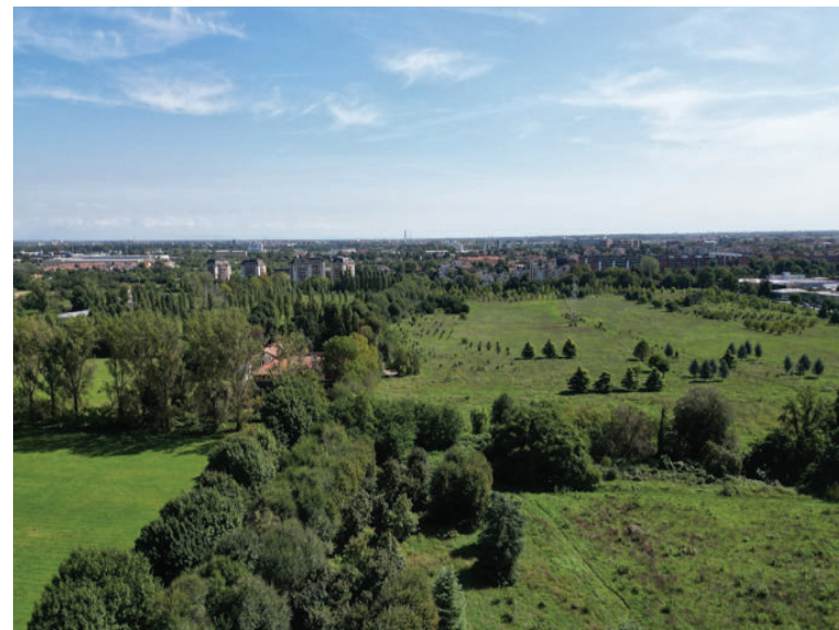
Sopra, il grande polmone verde del Golfo Agricolo che si estende tra Milano2 e Rovagnasco, diventato dal 2024 di proprietà comunale

Parco Alhambra e le aree a nord del Villaggio Ambrosiano. Aree accomunate dalla funzione di tutela del verde e che ora vengono ricomprese in una cornice di protezione sovracomunale. Il Parco nasce con l'obiettivo di promuovere lo studio, la conservazione e il miglioramento dell'ambiente, superando una gestione frammentata dei singoli ambiti.